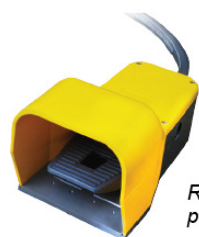
Remote control - pedal