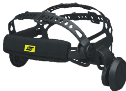
Harnais Halo™ très confortable, doté de 5 points de contact (vue avant)

Pour en savoir plus, rendez-vous sur esab.com .