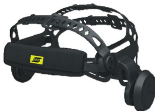
Harnais Halo™ très confortable, doté de 5 points de contact (vue avant)

Pour en savoir plus, rendez-vous sur esab.com .