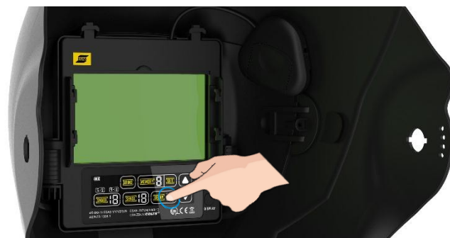
Classe optique ADF élevée, avec interface d'écran tactile couleur