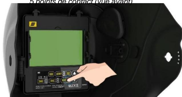
Classe optique ADF élevée, avec interface d'écran tactile couleur

Toutes les industries ayant recours au soudage