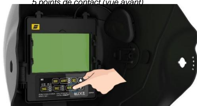
Classe optique ADF élevée, avec interface d'écran tactile couleur

Toutes les industries ayant recours au soudage