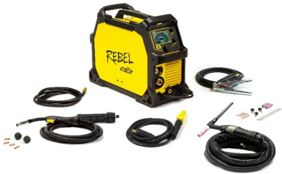
Rebel EMP 205ic AC/DC et ses accessoires.

ESAB a rendu possible l'impossible en fabricant le premier poste à souder compact et multi-procédés, qui rassemble les procédés MIG-MAG, fil fourré sans gaz, MMA, TIG DC et désormais TIG AC.