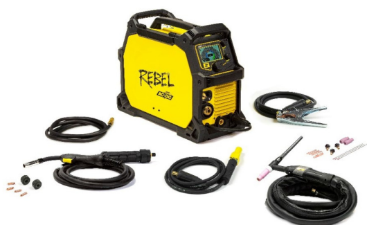
Rebel EMP 205ic AC/DC et ses accessoires.

ESAB a rendu possible l'impossible en fabricant le premier poste à souder compact et multi-procédés, qui rassemble les procédés MIG-MAG, fil fourré sans gaz, MMA, TIG DC et désormais TIG AC.