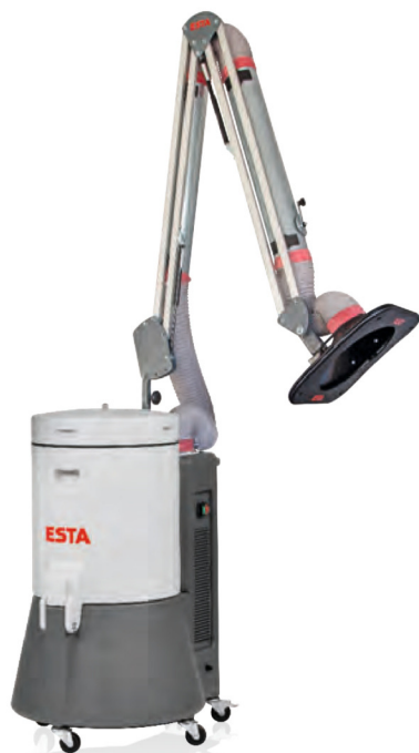
SRF K-10 version mobile