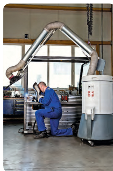
SRF K-10 en action