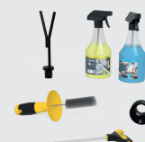
FOR FREE 1x 283999

Nos prix s'entendent hors taxes, transport et emballage en sus. Tous les prix en CHF (francs suisses). Paiement 30 jours net. Sous réserve de modifications techniques. Franco notre dépôt. Réserve à la revente. Nos conditions générales de vente s'appliquent. Sous réserve de modifications de prix et d'erreurs d'impression.